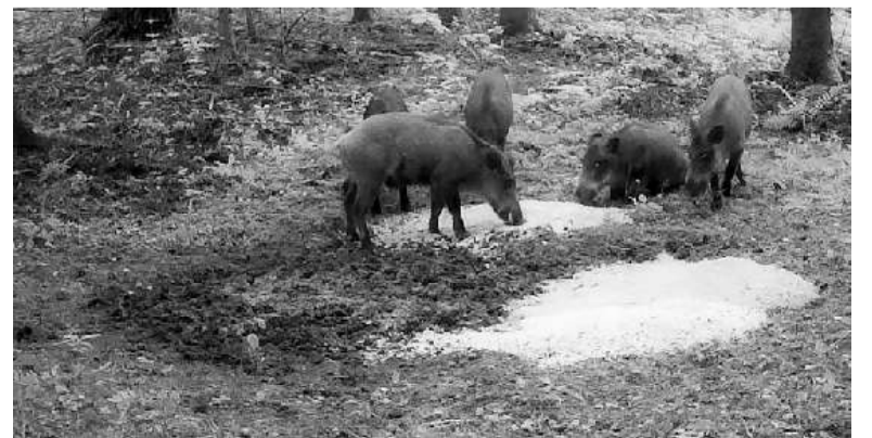
Фото из архива Бабынинского районного общества охотников и рыболовов.